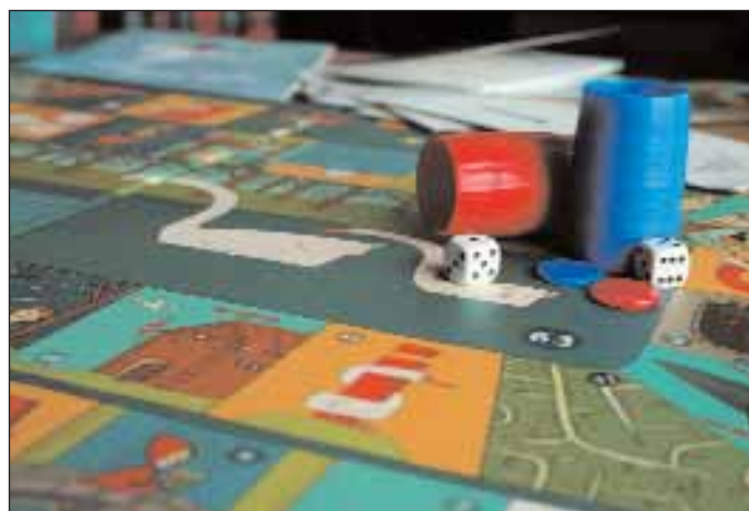
Materiais da campaña Hora de ler da Consellería de Educación